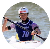
Amálie Hilgertová Vodní slalom

Spolu s UNIS podporujeme přes 20 vrcholových sportovců , například: